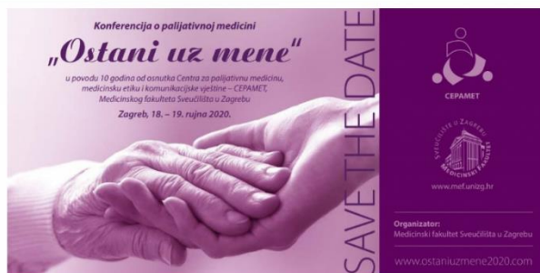
Konferencija o palijativnoj medicini „Ostani uz mene“ 10 godina CEPAMET-a Medicinskog fakulteta Sveučilišta u Zagrebu, Zagreb, 18. – 19. rujna 2020.

U povodu 10 godina od osnutka Centra za palijativnu medicinu, medicinsku etiku i komunikacijske vještine – CEPAMET, Medicinskog Fakulteta Sveučilišta u Zagrebu, 18. i 19. rujna 2020. godine održana je virtualna Konferencija o palijativnoj medicini „Ostani uz mene“ .